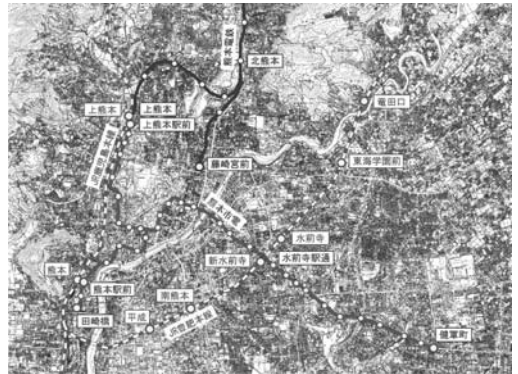
Fig. 1 熊本市の鉄軌道網

熊本市電は、これまでに全国で初めての数々の取り組みを進めてきている。特に昭和53年の車両の冷房化を皮切りに、昭和57年には鉄道・軌道車両を含めて初めての省エネルギーでメンテナンスが容易なVVVFインバータ方式電車の導入、平成9年には超低床電車の導入、平成14年にはレールを弾力性樹脂で固定して騒音や振動を低減する樹脂固定軌道を導入するなど、日本における路面電車の技術革新をり