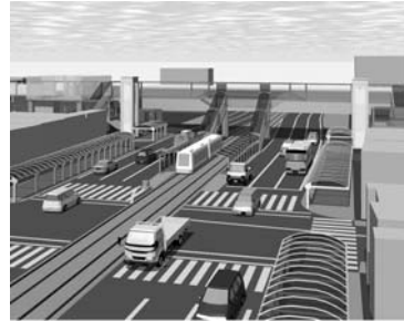
Fig. 3 新水前寺交通結節点改善事業のイメージ