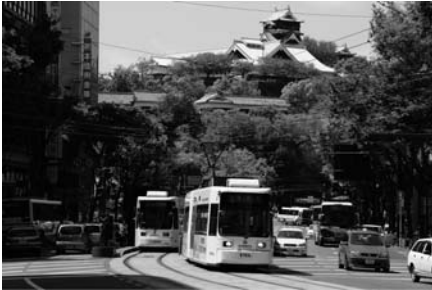
Fig. 2 通町を走行する熊本市電のLRV車両