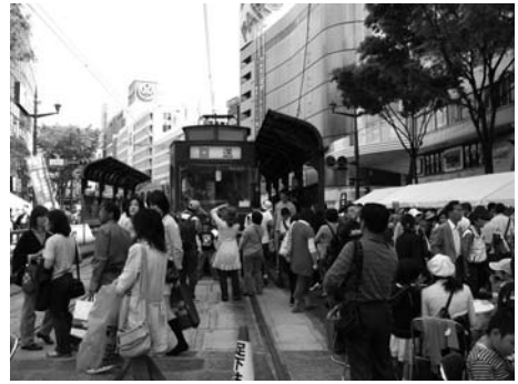
Fig. 4 通町筋歩行者天国時の車両ふれあい展示

熊本城築城400年にあわせて建設した本丸御殿は平成20年4月20日に一般公開された。これを記念し