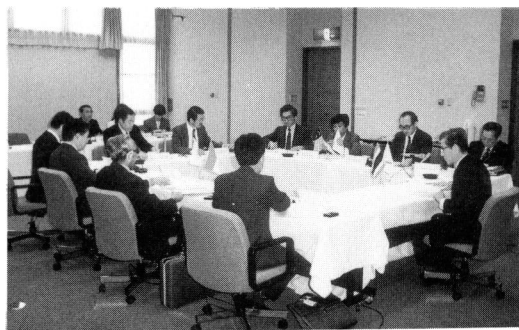
Fig. 3 国際諮問委員会風景

実行委員長によって委嘱された学識経験者及び関係諸官庁、諸団体など各界の人々から構成、IATSSフォーラムの講師を兼ねる顧問もいる。