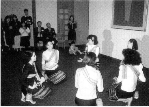
Fig. 4 交歓会の風景