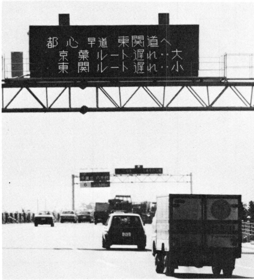
Fig.2 京葉・東関東道の可変情報板 (表示予定の例) Changeable message sign of Keiyo and Higashi Kanto expressway