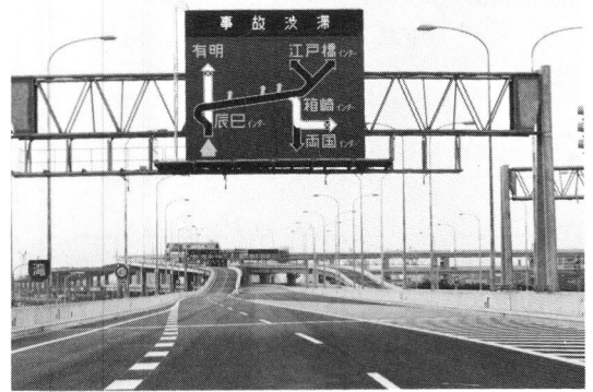
Fig.3 首都高速道路の図形情報板 Diagram message sign of Metropolitan expressway